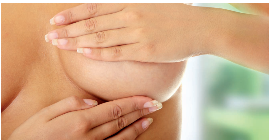
Selbstuntersuchung ist der erste und wichtigste Schritt zur Brustkrebs-Vorsorge

Die Einladung der Frauen nach Vechta oder ins umherfahrende „Mammobil“ erfolgt alle zwei Jahre. Kann der vorgeschlagene Termin nicht eingehalten werden, genügt ein Anruf.